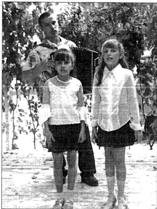
Юные краснохолмцы — участники праздничного концерта. 19 августа 2007 г.