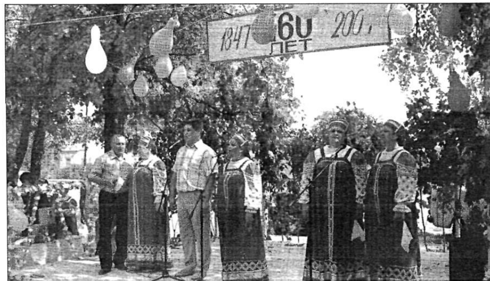
Выступает фольклорный коллектив из села Лесное. 19 августа 2007 г.

Верится, что произошло это предстательством всех праведно живших предков из Горнего мира, ходатайствующих о ныне живущих, а сохраненная здесь молитва не прекратится, а значит, продлится и жизнь села.