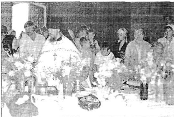
В Преображенском храме села Красный Холм перед молебном